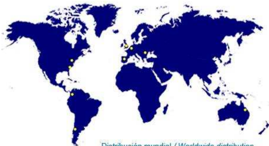
Distribución mundial / Worldwide distribution

Cada gama en diferentes alturas, diámetros, acabados y potencias. Each type in different heights, diameters, power and design construction.